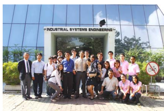
圖 8 大合照