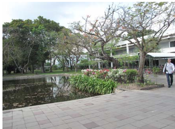
圖 2 AIT 校園環境圖

在參訪網路教育研究實驗室的過程中 (圖3)，有一件事情讓我的印象非常深刻，也就是網路教育研究實驗室的負責人給我們做了一個非常精彩的實驗室介紹 (圖4)，這位負責人是一位在學的博士班學生且在不知道我們會參訪其實驗室的情況之下做了一個非常好的英文報告。在此建議我們系上(IEM)的實驗室管理員應當需要有這份及時反應的能力，替系上搏得好得印象分數以及光彩。