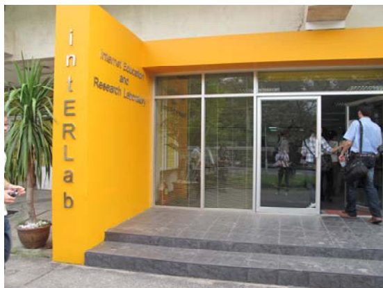
圖 3 網路教育研究實驗室

在參訪網路教育研究實驗室的過程中 (圖3)，有一件事情讓我的印象非常深刻，也就是網路教育研究實驗室的負責人給我們做了一個非常精彩的實驗室介紹 (圖4)，這位負責人是一位在學的博士班學生且在不知道我們會參訪其實驗室的情況之下做了一個非常好的英文報告。在此建議我們系上(IEM)的實驗室管理員應當需要有這份及時反應的能力，替系上搏得好得印象分數以及光彩。