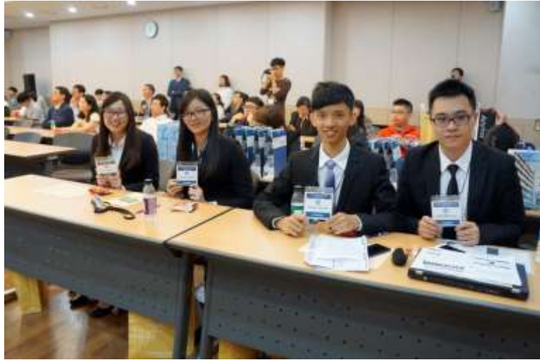
圖 3 參加 2017 Capstone Design Presentation