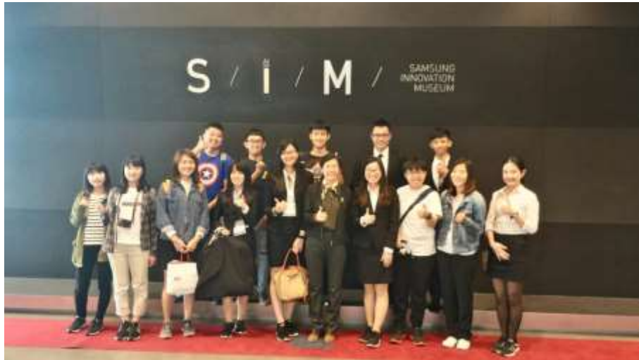
圖 5 參觀三星創新博物館

參訪之旅一眨眼結束了，很榮幸能夠有這個機會到國外專題報告，謝謝在過程中幫助我們的師長及朋友，讓我們能夠成功完成挑戰，為大學生涯畫下完美的句點。