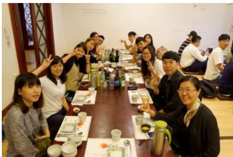
圖 2 與忠北國立大學學生的晚餐交流

在忠北國立大學時，我們參觀了該校 3D 列印實驗室以及工藝的工坊，這個工坊的運作模式有點像是一個社團，在這裡能夠讓學生開始自行創業並經營。印象最深刻的是當天的晚餐時光，那天我們和忠北國立大學的學生一同共進晚餐，互相分享了許多彼此的生活、文化或是食物等等，聊了很多韓國大學生喜歡的東西，像是韓國偶像團體或是韓劇，我們也跟韓國學生介紹台灣小吃，這時，跟我們同一桌的韓國學生興奮地說：今年初她到台灣旅遊時，有吃到一種餅乾，口感鹹鹹的，很好吃，現在想起來還是會讓她口水直流，我和我的夥伴左思右想，就是猜不出她說的是什麼東西，直到她拿起手機，打開照片，答案才揭曉，原來是前陣子很熱門的牛軋糖夾心餅乾！那天晚上的交流真的是一個很棒的體驗。