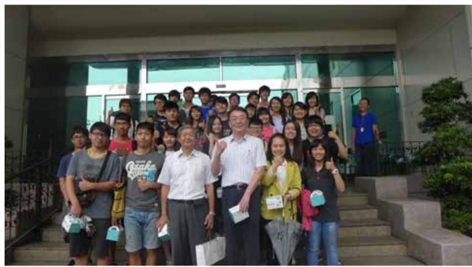
(一) 欣興電子 撰文/彭薇珊、王藝婷