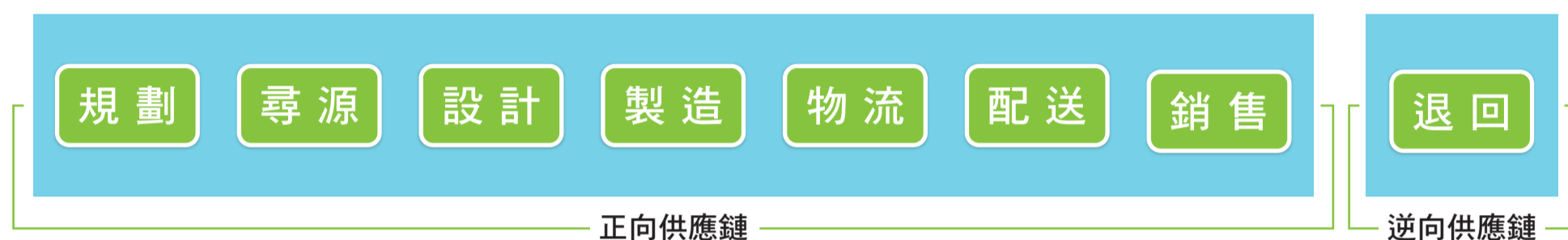
圖一、供應鏈相關團隊

2014的夏天特別熱，還未進入盛夏在台灣就已有瞬間電力需求創紀錄，而Google最近搜尋的兩件要聞，分別為2014世界杯足球賽及九月預計上市的iphone 6，一件為運動盛事，另一件為3C新品上市，雖然世足賽已結束，而離九月仍有兩個月時間，這兩則要文看似毫無關聯，但是這兩件事背後都有相同的企業關心問題-供應鏈管理。