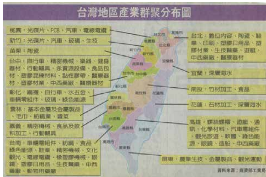
圖二、國內產業群聚分布

Kevin O'Marah, Eight disruptive technologies impacting supply chain, http://www.scmworld.com/Blog/Beyond-Supply-Chain/Eight-disruptive-technologies-impacting-supply-chain/